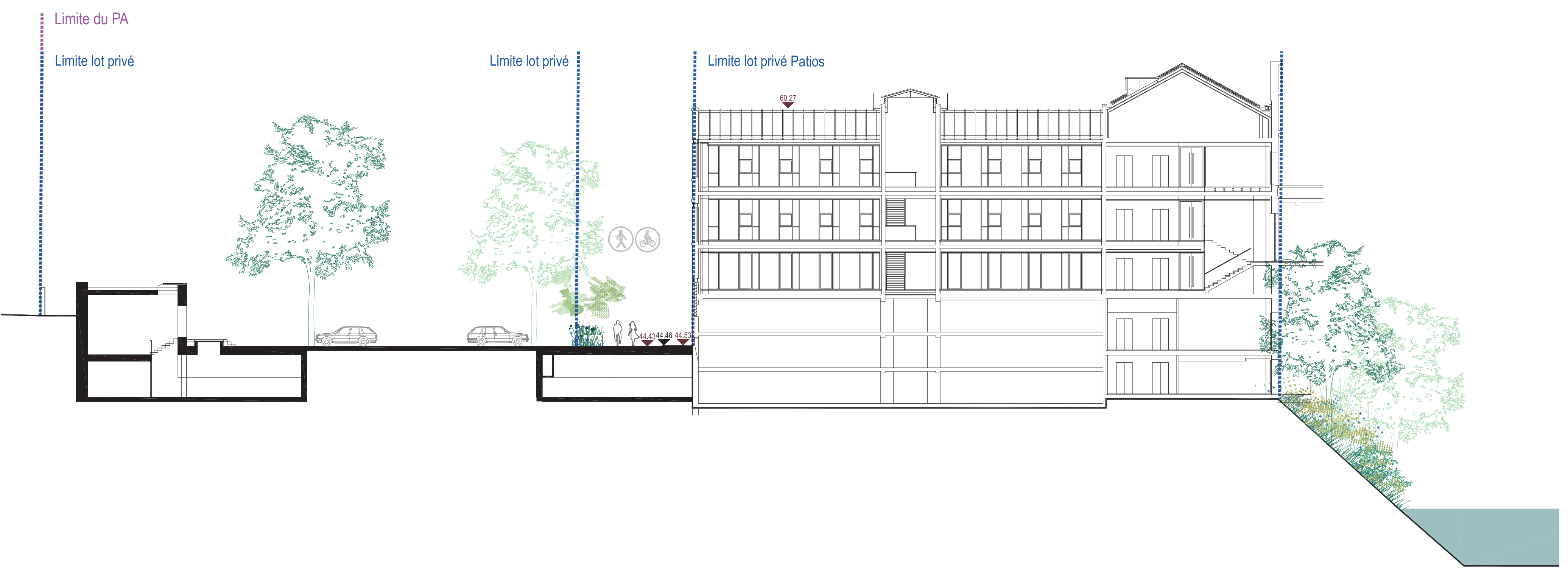
Coupe 200e - BB'