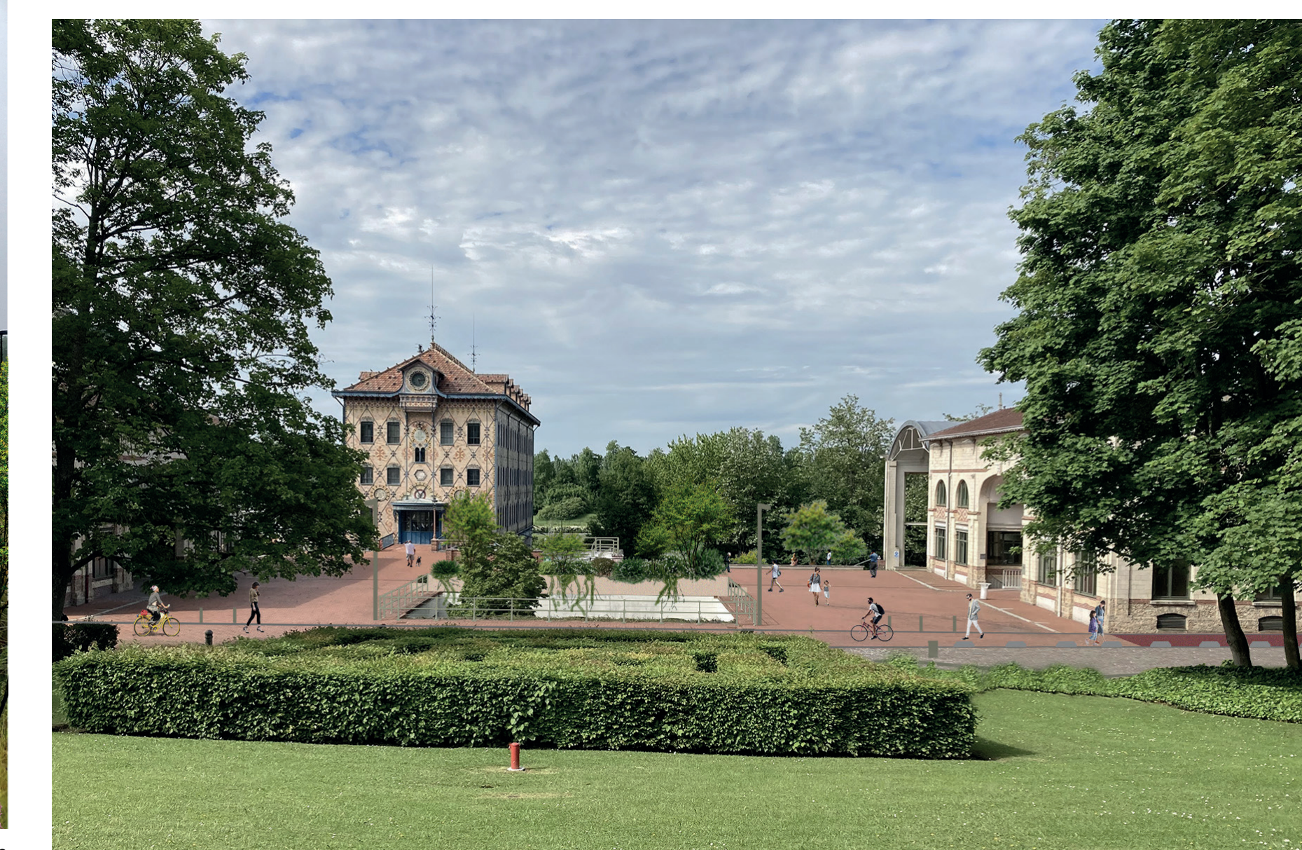
Vue 2 - Place du Moulin