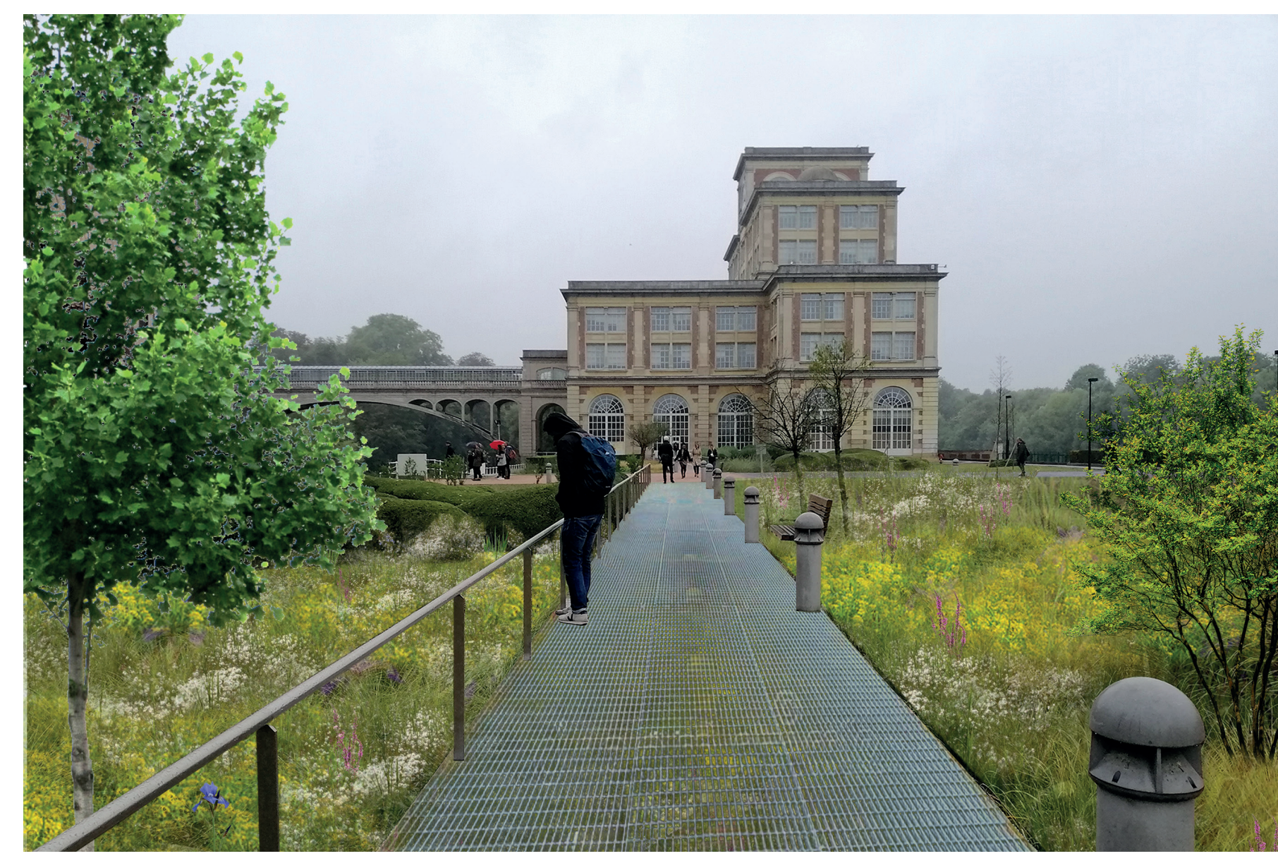
Vue 1 - Chemin de l'île